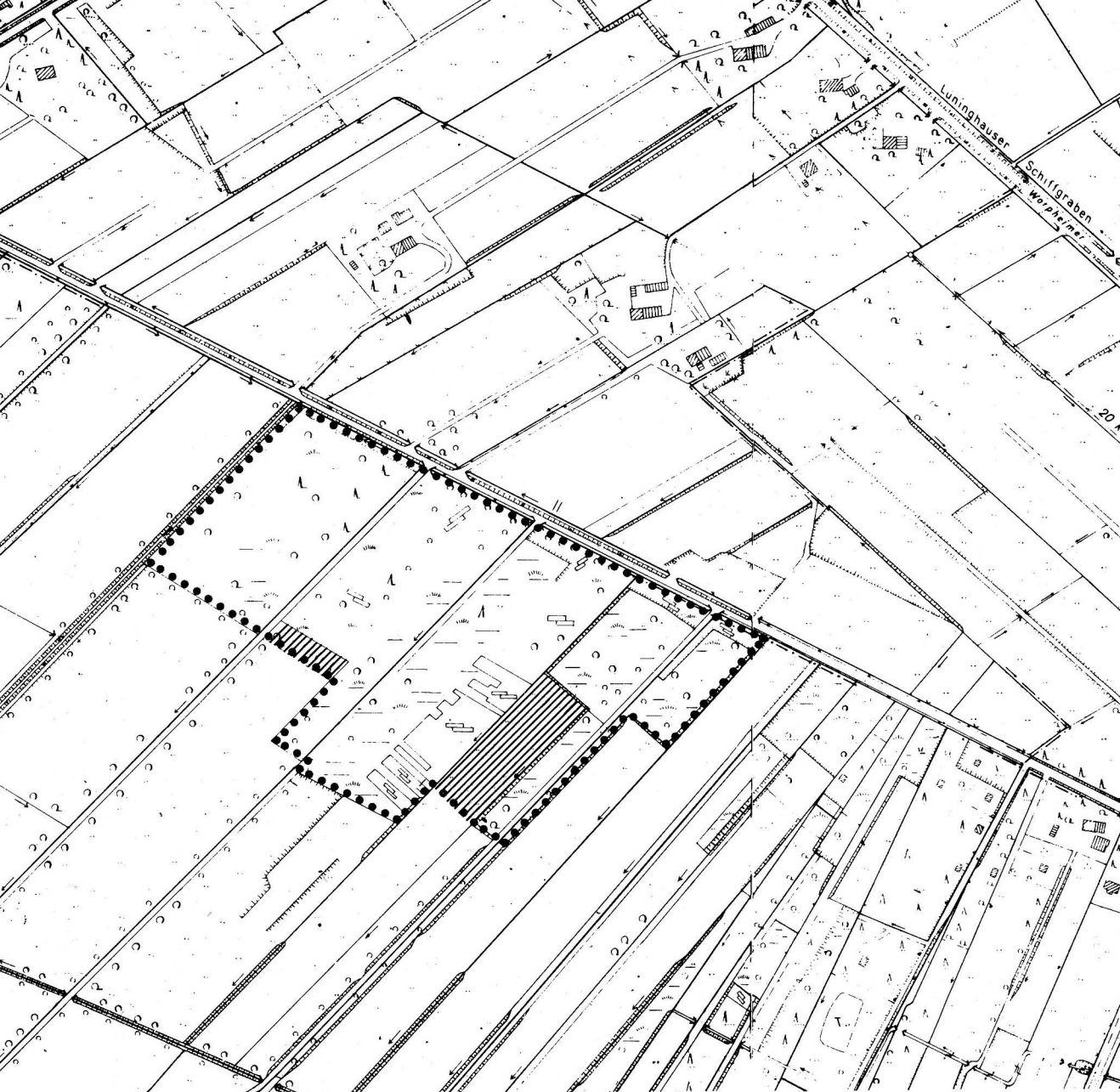
Karte über das Naturschutzgebiet „WESTLICHE HÄLFTE DES LANGEN MOORES“ Gemarkung: St. Jürgen , Gemeinde Lilienthal , im Landkreis Osterholz