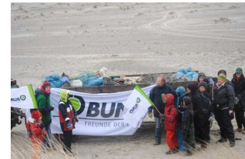
Beach Clean Ups