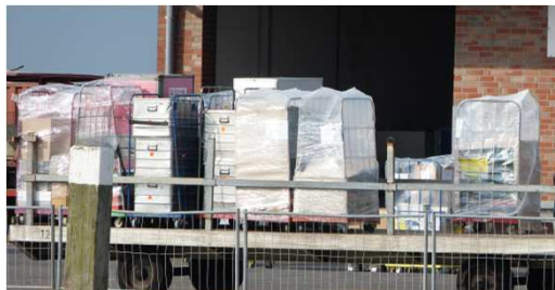
Plastikreduktion in der Logistikkette