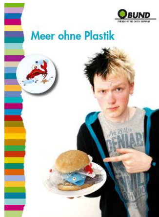
Sensibilisierung der Gäste