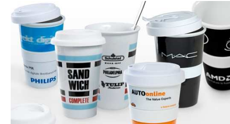
Environmental Guidelines for Events