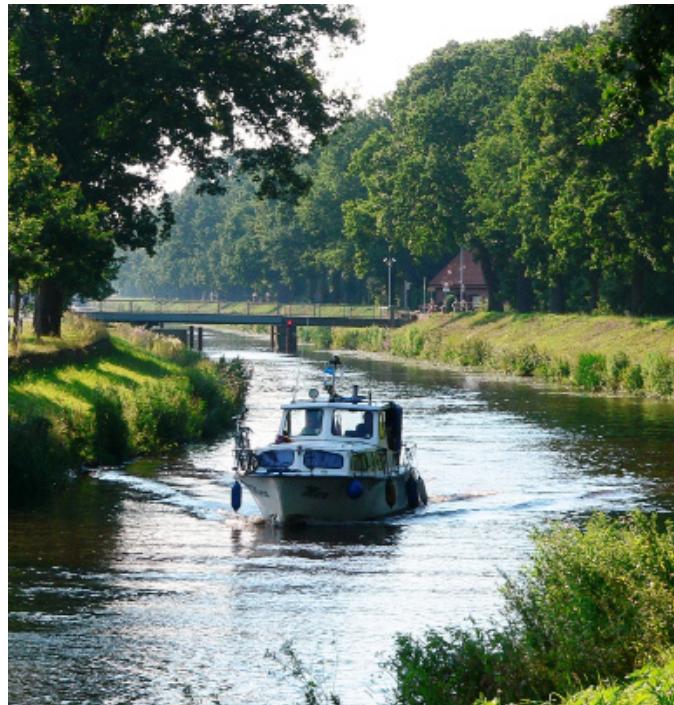
Sportschifffahrt auf dem Haren-Rütenbrock-Kanal

Abgerundet wird das Konzept des Landesbetriebes durch seine dezentrale Organisation: Die Direktion mit Standorten in Norden und Hannover nimmt lediglich steuernde und strategische Aufgaben wahr. Das operative Geschäft vor Ort übernehmen die elf Betriebsstellen, die an insgesamt 15 Standorten im ganzen Land präsent sind und die Kenntnis regionaler Belange und Besonderheiten gewährleisten.