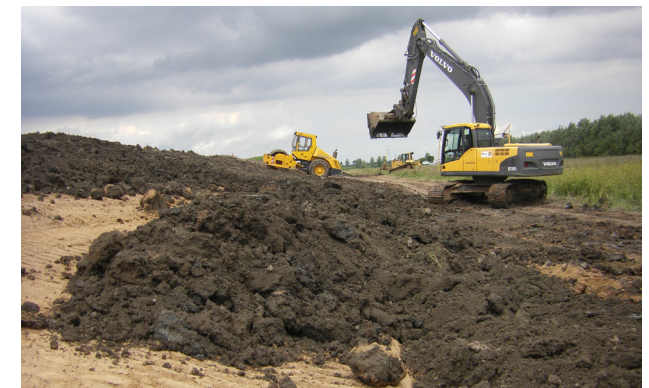
Deichbau an der Ems

Wir planen und betreuen Maßnahmen an den Küsten- und Hochwasserschutzanlagen des Deichverbandes „Heede-Aschendorf-Papenburg“ und wasserwirtschaftliche Maßnahmen für Dritte, berechnen die Hydraulik für die Ausweisung von Überschwemmungsgebieten und übernehmen die Planungen an landeseigenen Anlagen und Gewässern. Wir schließen Altarme an und entschlammen Entwässerungs- und Schifffahrtskanäle. Wir bauen Sohlgleiten, Umgehungsgerinne und sonstige Aufstiegsmöglichkeiten für Fische und Kleinlebewesen an Stauanlagen.