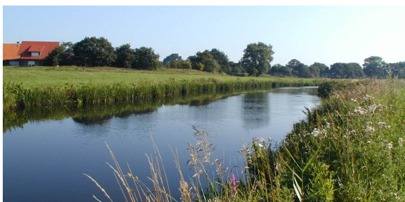
Vechte bei Emlichheim

Weiterhin ermitteln wir an rund 650 Messstellen die chemisch-physikalische und biologisch-ökologische Beschaffenheit sowie die Wasserstände der Gewässer – einschließlich Hochwasserwarndienst – und untersuchen Wasserproben mit hochempfindlichen Geräten in unserem Wasserlabor bis hin zu organischen Spurenstoffen. Wir überwachen industrielle Abwasseranlagen und deren Einleitungen in die Flüsse.