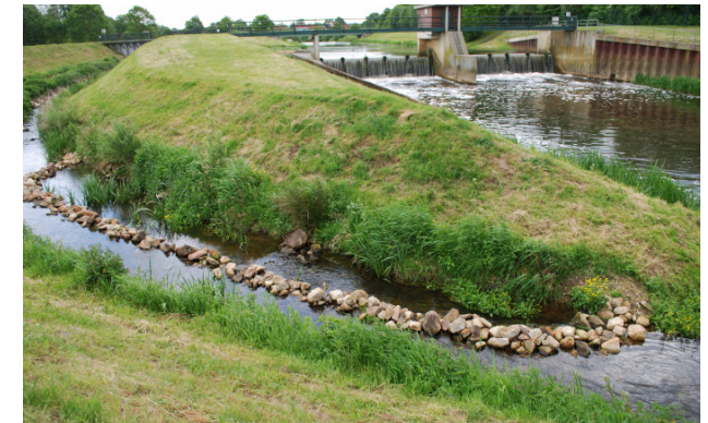
Naturnaher Fischaufstieg Vechtewehr Neuenhaus

Wir berücksichtigen bei unseren Arbeiten zur Sicherung des Wasserabflusses und Gewährleistung der Schifffahrt die ökologische Funktion der Gewässer und ihrer Ufer als Lebensraum für Pflanzen und Tiere sowie ihre erholungsrelevante Funktion als Teil des Landschaftsbildes.