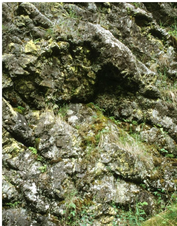
Abb. 1: Bodensteiner Klippen aus Sandstein (links) und Diabasfelswand im Harz (rechts)