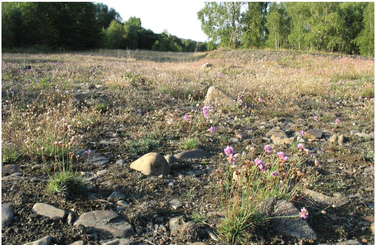
Abb. 1: Schwermetallrasen auf Flussschotter an der Oker im nördlichen Harzvorland