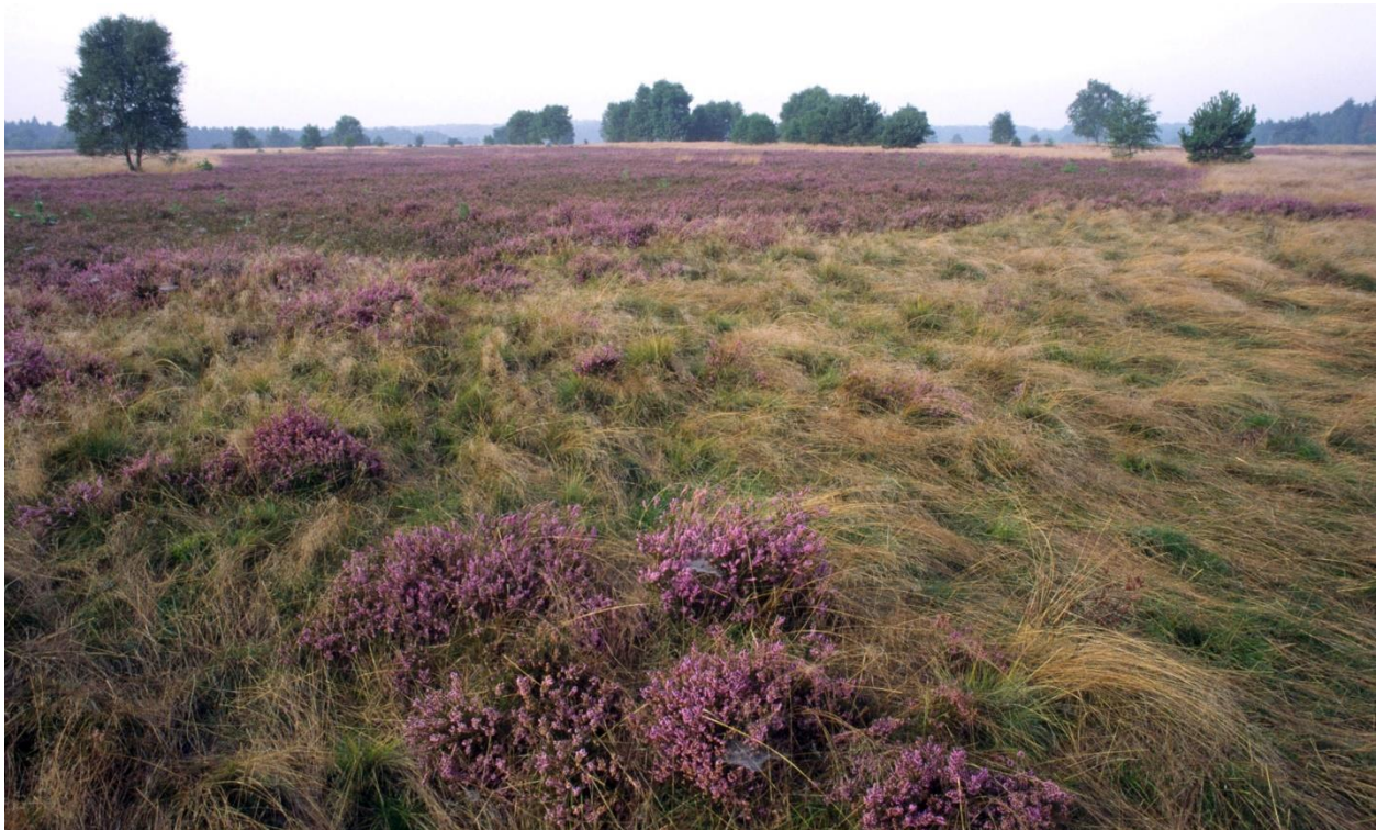
Abb. 1: Trockene Sandheide, im Vordergrund stark mit Draht-Schmiele vergrastetes Altersstadium, im Hintergrund Jugendstadium; Lüneburger Heide bei Handeloh