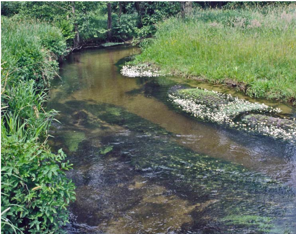
Abb. 1: Kalkarmer, schnellfließender Geestbach mit flutender Wasservegetation; Lutter in der Südheide