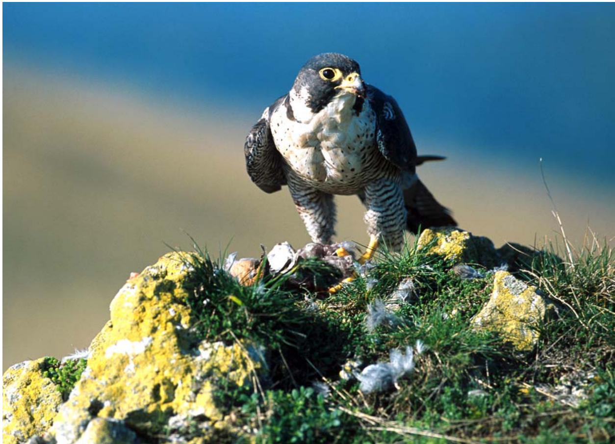
Abb. 1: Wanderfalke