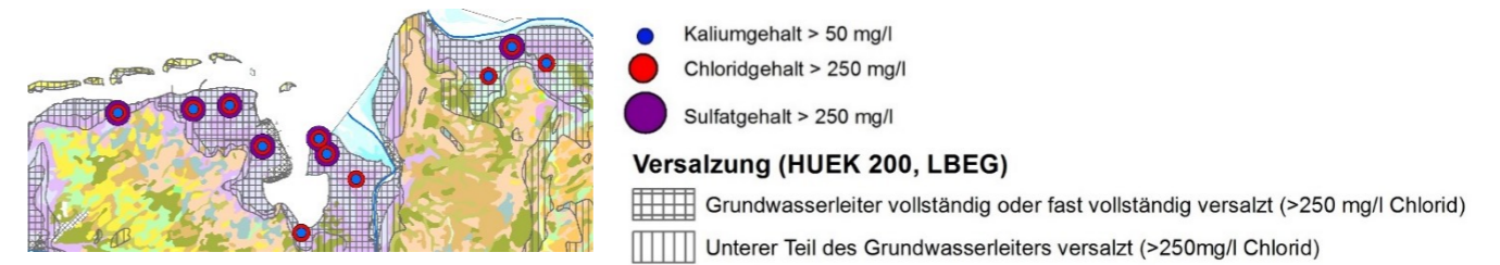
Abbildung 2: Sehr hohe Kaliumgehalte haben ihre Ursache in der Küstenversalzung.