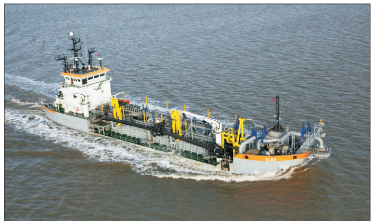
Abb. 3: Hopperbagger, der den Sand an der Robbenplate entnimmt und zur Koppelstation transportiert

An der Koppelstation wird das Baggerschiff mit einer ca. 100 m lange Schwimmleitung ver-