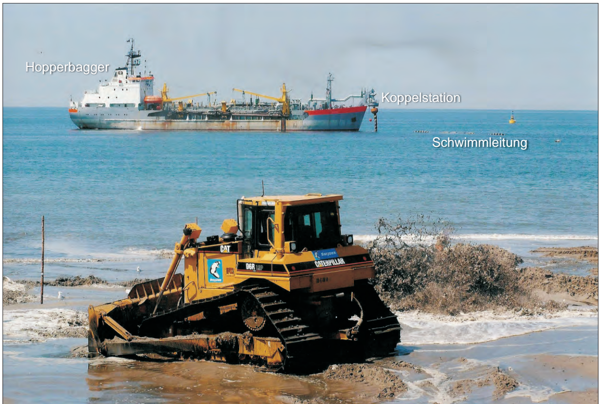
Abb. 4: Der Hopperbagger spült den Sand über Koppelstation und Schwimmleitung in die Bühnenfelder, wo er einplaniert wird

bunden. Über diese sowie eine auf dem Meeresgrund verlegte ca. 350 m lange Dükerleitung wird ein Sand-Wasser-Gemisch in Richtung Strand gepumpt. Eine Längsleitung am Fuß des Deckwerks verteilt das Sand-Wasser-Gemisch in die einzelnen Bühnenfelder, wo sich der Sand ablagert. Die Einspülung wird durch Planiertrauben unterstützt (Abb. 4 und 5).