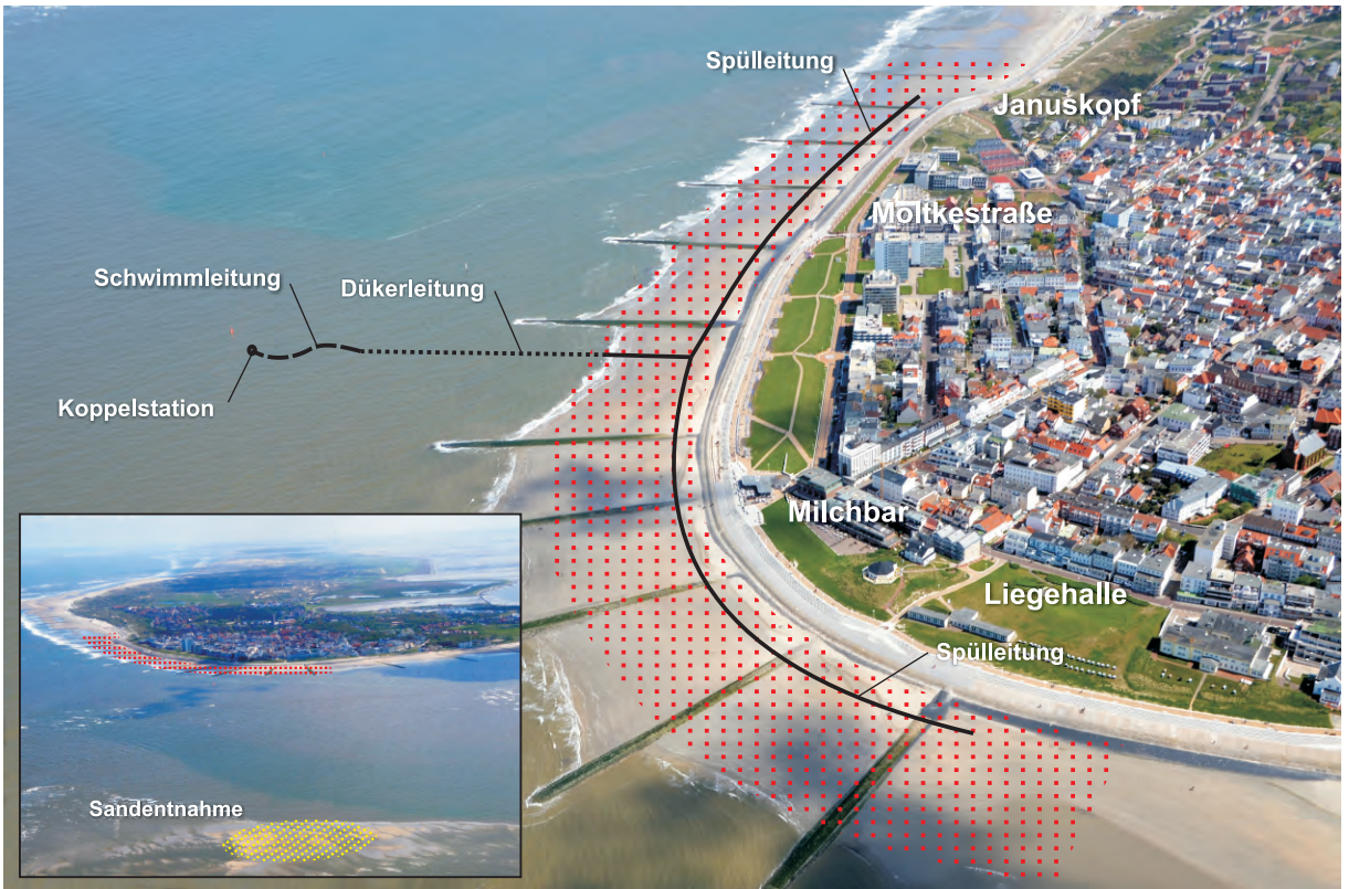
Aufspülbereich am Westkopf von Norderney