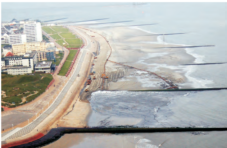
Abb. 5: Westkopf der Insel Norderney mit der Spüleitung der Strandaufspülung 2007

Herausgeber: NLWKN Betriebsstelle Norden-Norderney Jahnstraße 1, 26506 Norden, Telefon (0 49 31) 9 47-0, Fax 9 47-1 25 E-Mail: poststelle@nlwkn-nor.niedersachsen.de Abbildungen: Titel, Abb. 5 Wirdemann/NLWKN Abb. 1, 2 NLWKN Abb. 3, 4 Baggerbedrijf de Boer - Dutch Dredging Druck: SKN Druck und Verlag Gedruckt auf chlorfrei gebleichtem Papier